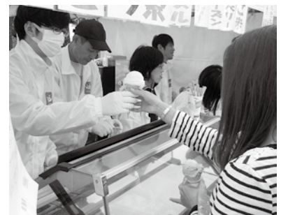
(長蛇の列で大忙しだった HARU のディッシュアイス)