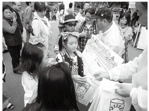
(アンケートボードに回答シールを貼る子供たち)