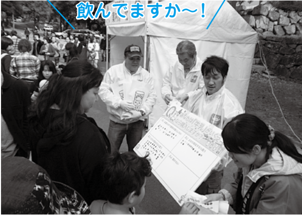
(アンケートボードを使っでの牛乳PR)

「アンケートボードを使った牛乳PR」は、二日目の日曜日は、秋晴れのもと「ミルクシェイク」や牛乳・乳製品の販売が好調で、「手作りアイス」は朝から長蛇の行列が閉店まで続き大盛況のうちにイベントが終了した。