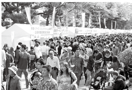
(多くの来場者で賑わった HARU ブース (左端))