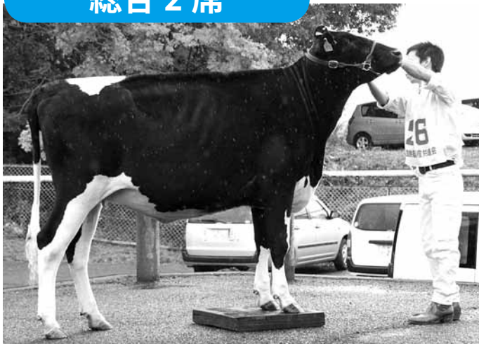
名 号：ウイステリア ブツク スーパーヤナギ (H 23.5.10 生まれ) 出品者：藤本雄紀さん(庄原市大久保町)