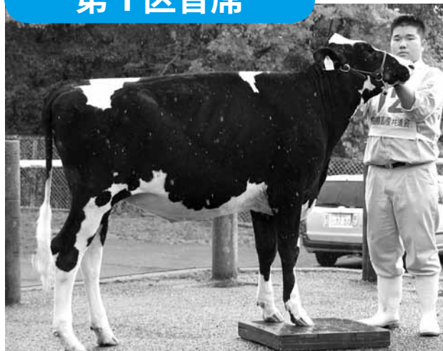
名 号：シヨウジツ カスガ スーパーモモ (H 23.10.19 生まれ) 出品者：県立庄原実業高等学校(庄原市西本町)